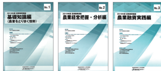
本通信講座テキスト

試験結果 受験者全員に、正解番号と受験者の解答を対比した「成績通知書」を交付し、合格者には、「合格証書」を発行します。