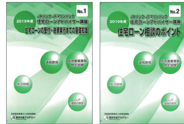
本通信講座テキスト

試験結果 受験者全員に、正解番号と受験者の解答を対比した「成績通知書」を交付し、合格者には、「合格証書」を発行します。