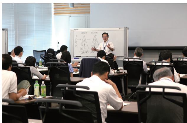
社会構造の変化について、講師の解説を聞く受講者たち。

関も「資産運用提案業務」が重要となり、「顧客本位の営業スタイル」が必要になってきているわけです。